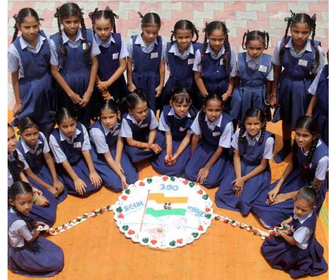
રક્ષાબંધન પહેલા જવિદ્યાર્થીઓ દ્વારા સ્કુલમાં રક્ષાબંધનની ઉજવણી કરવામાં આવી હતી.